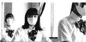
教育現場・研究機関

お客様訪問がある接客クルーやどうしても出社せざるを得ない職場でも、安心して働けることを目指します。